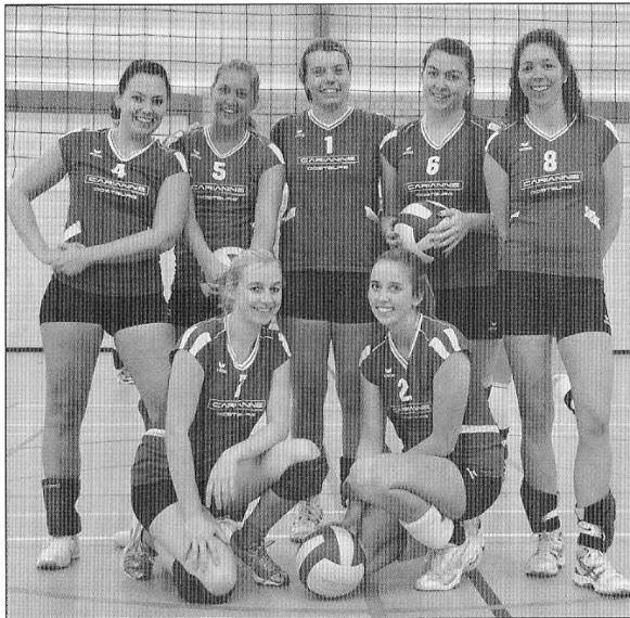
IJVC 1 dat sinds dit seizoen gesponsord wordt door Carianne Mode uit Oostburg.

Bestuurlijk hebben we ook de zaak volledig op de rails. Ons enige probleem in de nabije toekomst zal zijn om de begroting sluitend te houden. De zaalhuur is een flinke kostenpost. Wij spelen en trainen in De Eenhoorn te Oostburg, omdat de gymzaal in IJzendijke niet aan de reglementaire afmetingen voldoet. Dat kost geld. Ook het scheidsrechteren is heden ten dage niet makkelijk. De club moet scheidsrechters leveren en dat is niet altijd even makkelijk omdat de meiden ook spelen."